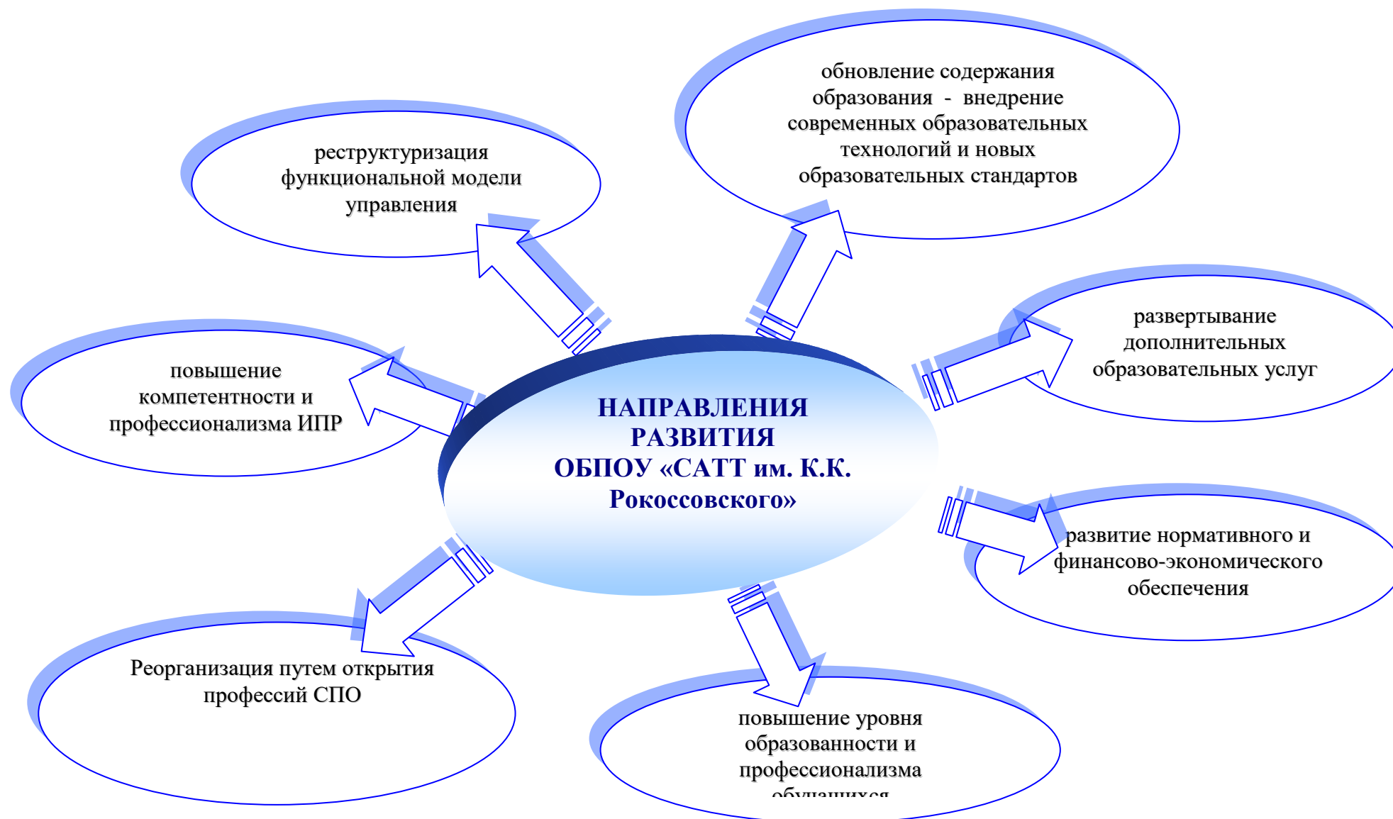
Схема. ОСНОВНЫЕ НАПРАВЛЕНИЯ РАЗВИТИЯ ТЕХНИКУМА